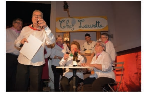
Certaines chansons étaient accompagnées d'une petite mise en scène, comme ici pour la chanson « Chez Laurette »