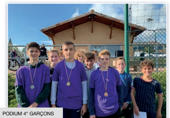
PODIUM 4° GARÇONS