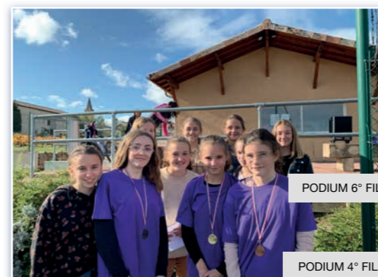
PODIUM 4° FILLES