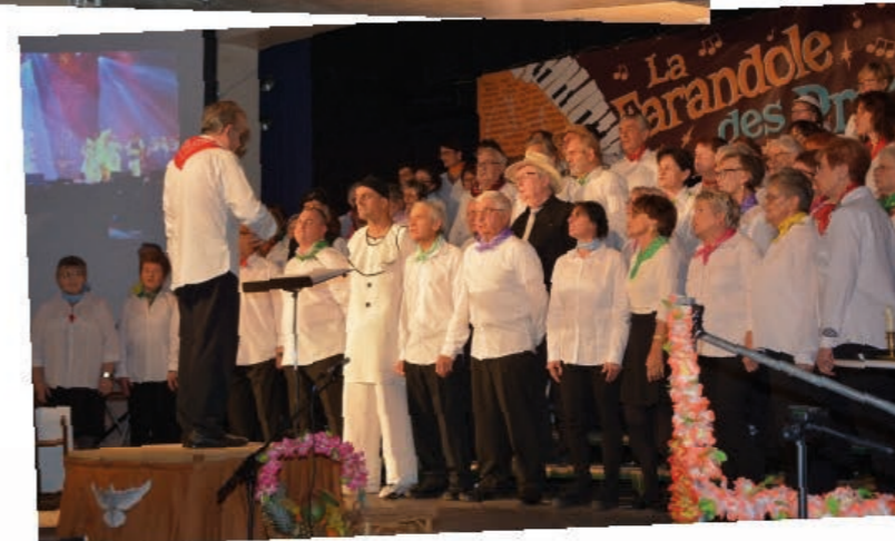
Nous avons donné 3 concerts et comme d'habitude devant un public fidèle qui a pu nous accompagner pour certains chants.